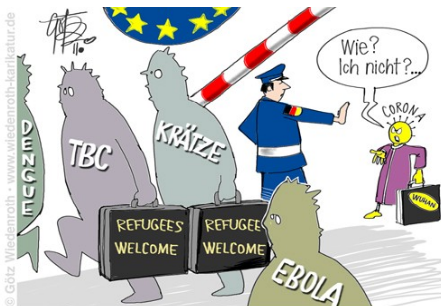
"... aber die da dürfen schon, oder was?"