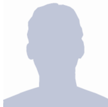
N. N. Bundesminister für „Gesundheit“ (sic!)

Jetzt ist der Feind ins Land gedrungen: Das Coronavirus „2019-nCoV“ – neuer Name: „SARS-CoV-2“ – der Erreger der tödlichen Lungenkrankheit „Covid-19“ ist hier!