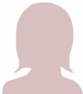
Ursula von der Leyen Präsidentin der Europäischen Kommission.

Das sind die Visagen der EU- und Deutschland-Politiker, von denen ich am Beginn der Wuhan-Virus-Krise kein Wort zur Vorsorge gehört oder gelesen habe, und die es auch heute noch unterlassen, die EU- und Deutschland-Grenzen „wasserdicht“ zu schließen: